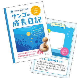
サンゴスタンプラリー

完成した「サンゴの成長日記」はお持ち帰りいただき、ご家庭でお子様も楽しく学べる読み物としてもお使いいただけます。