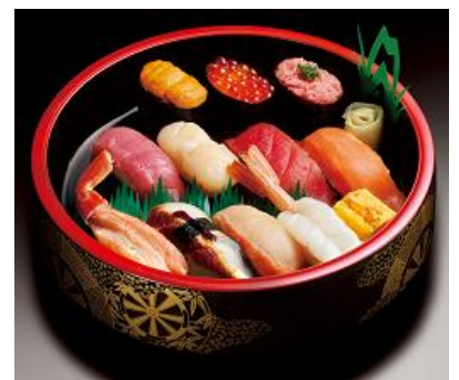
本マグロ中トロを使用した贅沢な一桶

商品についてのお問い合わせ先：ライドオンエクスプレスお客様相談室 0120-594-096