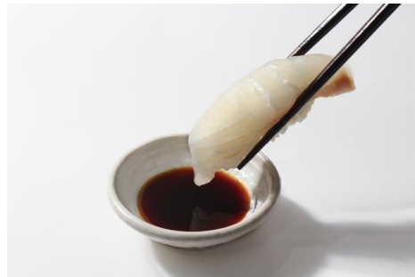
近大生まれ 愛南ゴールド真鯛