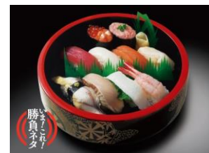
四万十（しまんと）1人前 ¥1,814（税込）