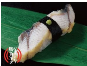
うなぎ白焼き 1貫 486円（税込）

「四万十川」の支流にある豊富な地下水でじっくりと養殖された、臭みが少なく肉厚で脂のりも程よい『うなぎ白焼き』と、春から夏にかけて高知で水揚げされる、クセがなく淡泊な味わいの『藁焼きシイラ』、対照的な2貫をお楽しみいただけます。