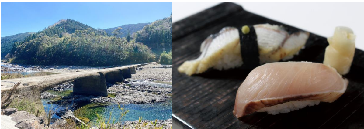
8月31日（水）まで、『うなぎ白焼き』・『藁焼きシイラ』を期間限定販売

※販売特設ページ： https://www.ginsara.jp/campaign/202207_unagisirayaki/ （※2022/7/15～公開）