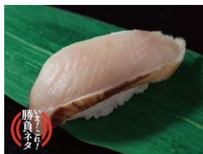
藁焼きシイラ 1貫 270円（税込）