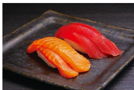
2重ネタイメージ マグロ・サーモン