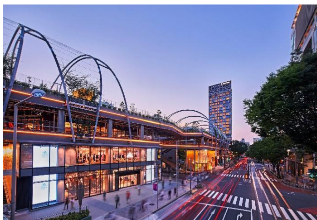
▲RAYARD MIYASHITA PARK 外観

ベクトルグループは今後も“いいモノを世の中に広め人々を幸せに”をモットーに、顧客に必要とされる新規サービス・プランの提供を通じ、企業のマーケティング・ブランディング活動のサポートを行ってまいります。