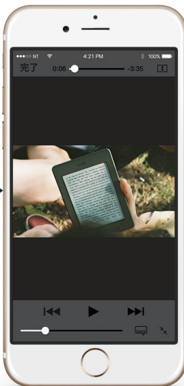
動画部分をタップで 再生プレイヤーが起動