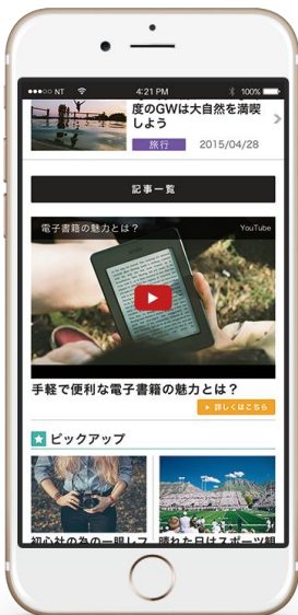
動画の埋め込みも可能