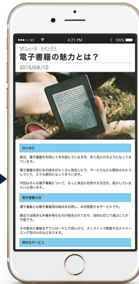
別サイトへのリンクも可能