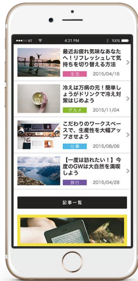
動画領域が50%表示で 自動再生