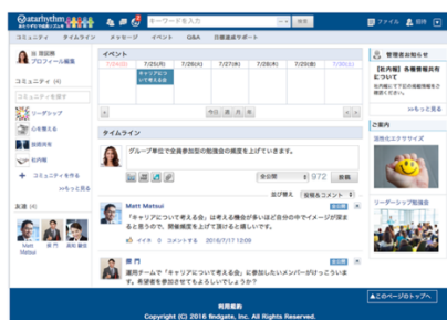
あたりずむ画面イメージ