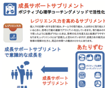
成長サポートサブリメント