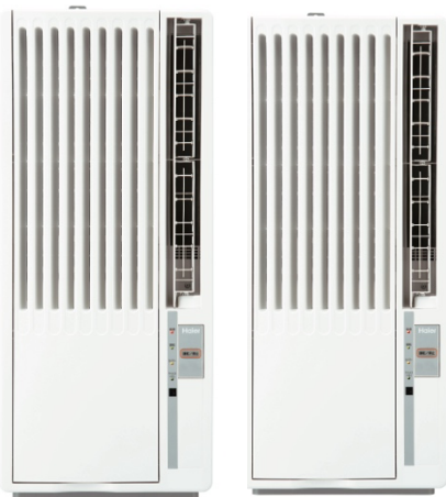
窓用ルームエアコン（JA-18Y/JA-16Y）

ハイアールジャパンセールズ株式会社（本社：大阪市、代表取締役社長：杜 鏡国）は、工事不要で設置簡単な「窓用ルームエアコン（JA-18Y/JA-16Y）」と、スリムボディで使用場所を選ばない「床置型スポットエアコン（JA-SPH25M/JA-SP25Z）」の4機種を、全国の家電量販店、ホームセンター、GMS、WEB通販などで2023年4月1日より順次発売いたします。