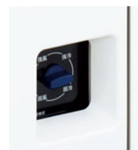
風量調節ツマミ（JA-SPH25M / JA-SP25Z）