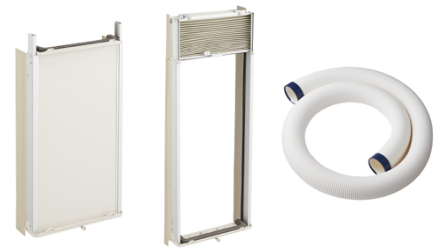
（左）ウィンドウクーラー用延長枠（JA-E16E）

床置き型スポットエアコンでは、3mの延長用冷風ダクト（JA-ESP25E）をご用意。作業場所に製品を設置できない時でも、延長ダクトを装着いただくことで、離れた場所から冷風を送ることができます。