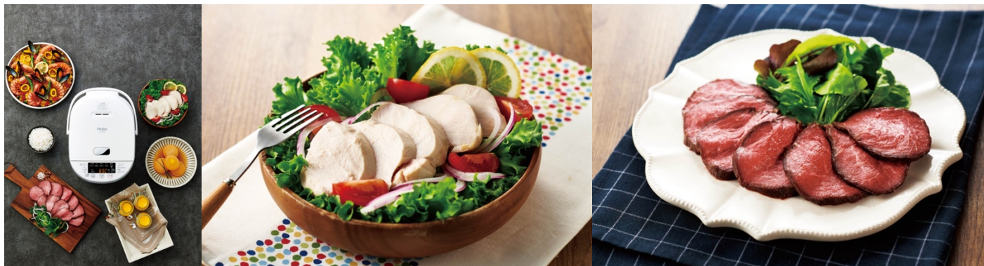
調理メニューイメージ

煮込み・低温調理・パエリアなどの4つの調理メニューを搭載。例えば低温調理メニューでは40℃～80℃の範囲で1℃単位の温度設定が可能のため、食材を袋に入れ内釜の水にひたして温度と時間を設定するだけで、本格的な低温調理が楽しめます。また忙しい朝や帰りが遅くなったときなど、高速炊飯モードを使えば約24分（1合の場合）で炊きたてのおいしいごはんをお召し上がりいただけます。さらに「4メモリータイマー」を採用、朝と晩、平日と休日など異なる時間でもご飯が炊けるように設定いただけます。