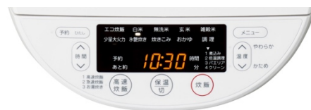
JJ-M56B (W)操作パネルイメージ