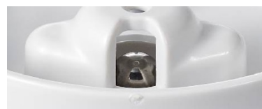
金属ボールのある調圧弁