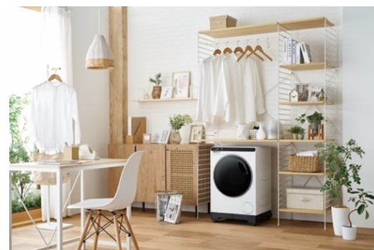
JW-T45SA (W/ホワイト) 使用イメージ

一般的な防水パンにも収まる「幅516×奥行537×高さ790mm」のコンパクト設計。ワンルームのお部屋や、マンション・アパートの限られたランドリー空間にも設置しやすい一台です。また、洗濯機上部の空間を有効活用できるため、収納やインテリアの自由度を高め、スペースパフォーマンスの最大化にも貢献します。インテリアにフィットするスタイリッシュなデザインで、ランドリールームを自分好みのイメージに上げることができます。