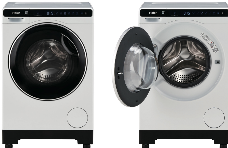
4.5kg ドラム式洗濯機 JW-T45SA (W/ホワイト)

ハイアール ジャパン セールズ株式会社（本社：大阪市、代表取締役社長：杜 鏡国）は、ひとり暮らしにぴったりな幅約52cm・奥行約54cm・高さ約79cmと業界最小クラス *1 の「ミニドラム」、4.5kg ドラム式洗濯機（JW-T45SA）を2025年2月より、全国の家電量販店、ホームセンター、GMS、WEB 通販などで順次発売いたします。