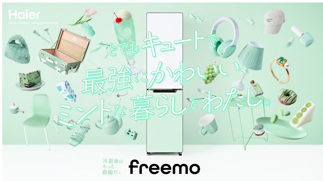
208L 冷凍冷蔵庫（JR-SX21T）『freemo』（WG/ホワイト&グリーン） キービジュアル

そしてこの度、20代後半～30代前半のひとり暮らしの女性をターゲットに、キュートで大人かわいい暮らしを演出できる、ホワイトとミントグリーンのツートンカラーを新色としてWEB限定で発売いたします。