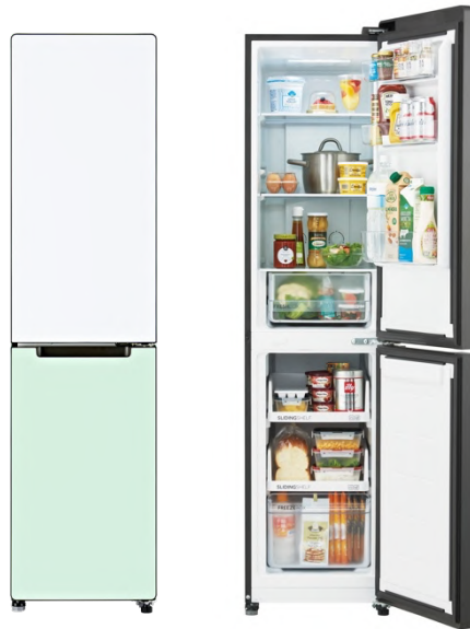
208L 冷凍冷蔵庫（JR-SX21T）『freemo』（WG/ホワイト&グリーン）

ハイアール ジャパン セールス株式会社（本社：大阪市、代表取締役社長：杜 鏡国）は、幅約 45cm のスリムボディながら、使いやすい3段引き出し式の74L「ジャイアントフリーザー」を装備した208L 冷凍冷蔵庫（JR-SX21T）『freemo（フリーモ）』の新色「ホワイト&グリーン」を2025年2月より家電量販店のECサイトなどWEB限定で順次発売いたします。