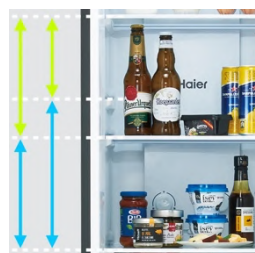
高さ調整可能トレイイメージ

134L 収納可能な冷蔵室には、収納する食品により棚の高さを変えられる「高さ調整可能トレイ」や、サッと拭くだけでお手入れがしやすい「強化ガラストレイ」、におい移りが気になる肉や魚の収納に便利な「フレッシュボックス」などを装備。また、2Lペットボトルが3本収納可能な ※2 「すっきりポケット」も搭載し、収納力と利便性を充実させております。