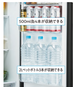
すっきりポケット使用イメージ