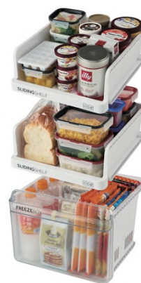
引き出し式トレイ・引き出し式クリアバスケット 合成イメージ