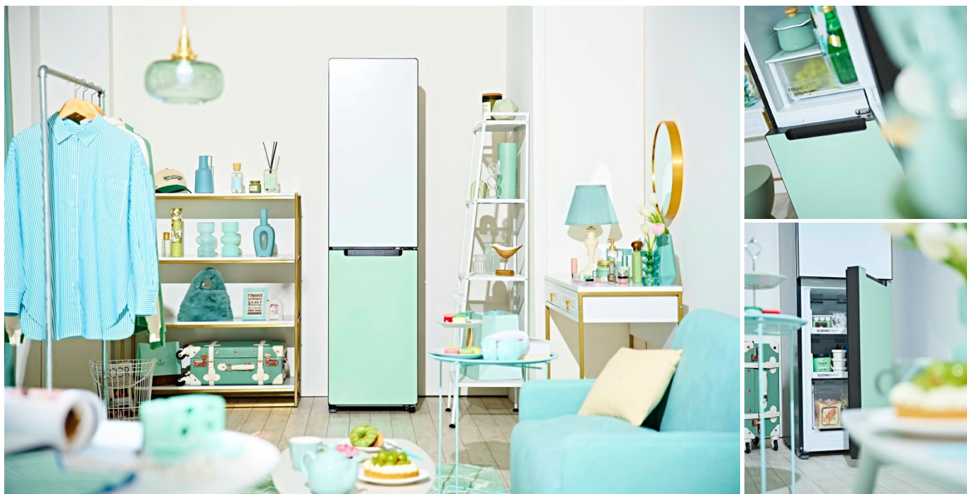
208L 冷凍冷蔵庫(JR-SX21T)『freemo』(WG/ホワイト&グリーン) 使用イメージ

『freemo』の新色テーマは、「とてもキュートで最強にかわいい、ミントな暮らしとわたし。」です。従来の定番カラーにとらわれず、ホワイトとミントグリーンを組み合わせたツートンカラーを採用しました。キュートでかわいい印象を持ちながらも、さりげない大人っぽさを感じる配色が、おしゃれなひとり暮らし空間を演出します。