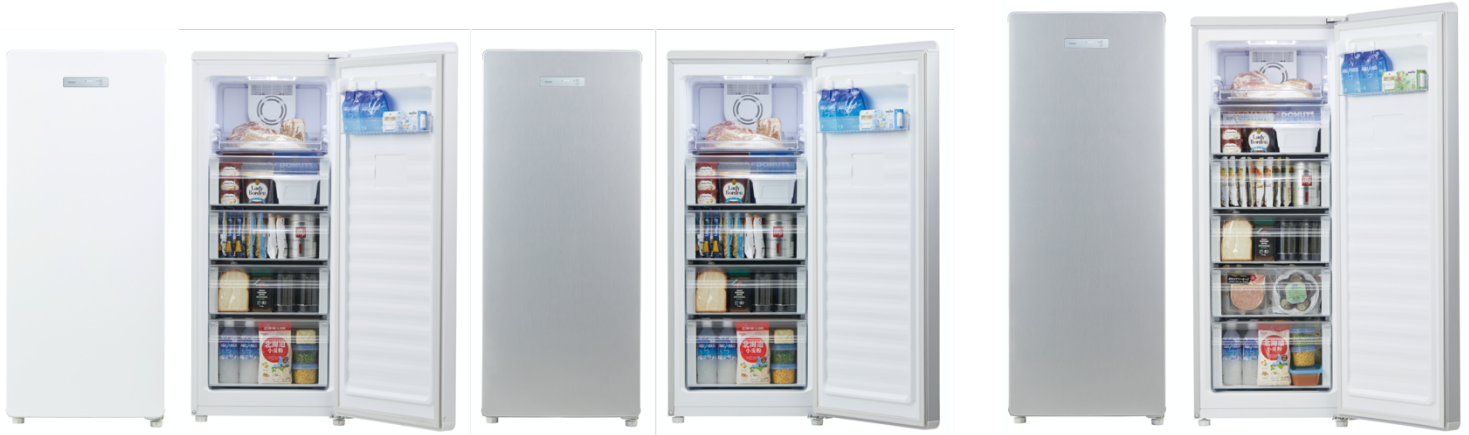
138L前開き式冷凍庫（JF-NUF138C） W/ホワイト・S/シルバー

ハイアールジャパンセールズ株式会社（本社：大阪市、代表取締役社長：杜 鏡国）は、収納力や利便性にこだわりながら、省エネ基準達成率を大幅に向上させた ※1 138L 前開き式冷凍庫（JF-NUF138C）と153L 前開き式冷凍庫（JF-NUF153C）を、2022年4月1日より全国の家電量販店、ホームセンター、GMS、WEB 通販などで順次発売いたします。