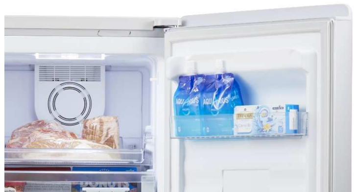
ドアポケットはスパイスや出し入れの多い食品の収納にも最適