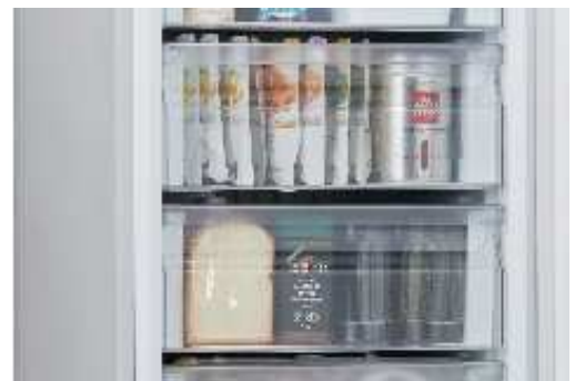
※クリアバスケット使用イメージ