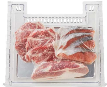
※アルミトレイ使用イメージ

熱伝導率の高い「アルミトレイ」を付属することで、必要に応じてより一層の急速冷凍も可能に。まとめ買いした肉や魚介類などの保存にも適しています。 ※アルミトレイの付属は JF-NUF153A, JF-NUF138A のみ