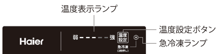
※JF-NUF153A/JF-NUF138A 操作パネル説明イラスト

※温度設定：JF-NUF153A、JF-NUF138Aは「弱～強」の5段階、JF-NU102Aは「 -16^{\circ}\text{C} ～ -24^{\circ}\text{C} 」の範囲、 1^{\circ}\text{C} 単位。