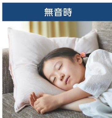
お子さまの眠りを妨げない

本商品には、操作音や終了ブザーの音量を、使用シーンに合わせて4段階で調節できる音量調節機能が搭載されています。例えば、小さなお子さまが寝ている時は無音設定に、洗濯の終了音を聞き逃したくない時は大音量に。まわりの環境に合わせて最適な音量でご使用いただけます。