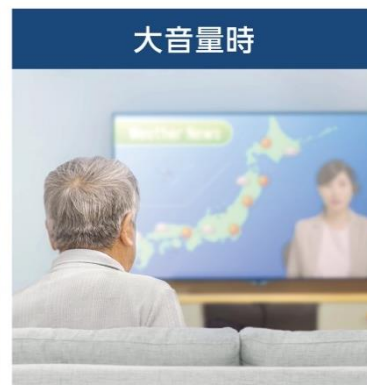
テレビの音が大きくても気づきやすい