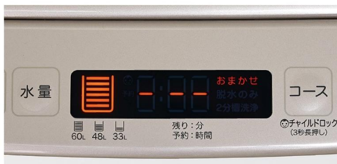
おまかせ洗濯 イメージ