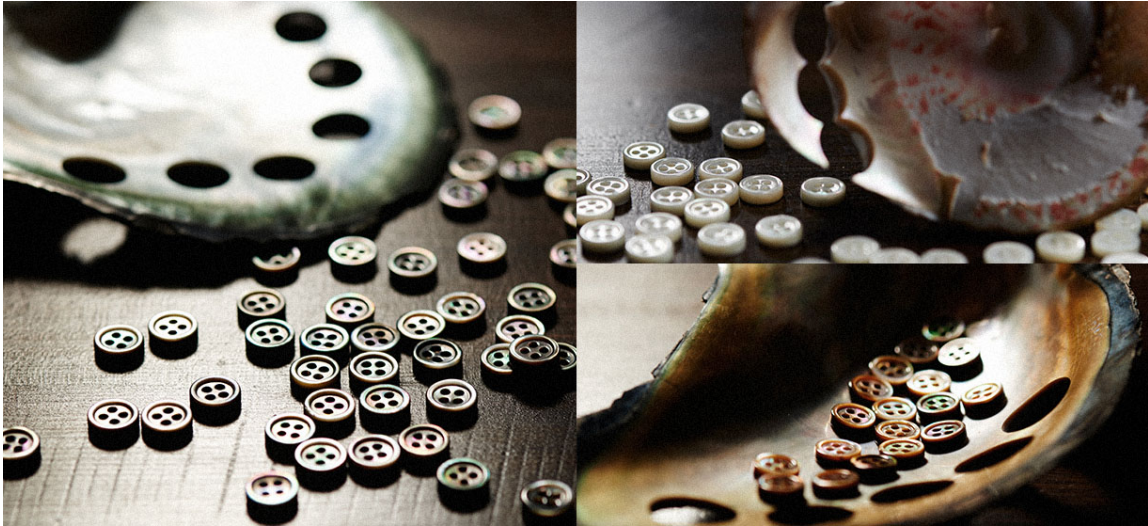
国内で加工された貝ボタン。5つの母貝から6種類の貝ボタンをご用意しております。

KEI では日常着として手の届きやすい価格で、上質なものをお届けするため、産地を巡りながら直接工場とのものづくりをしています。安価で大量生産しやすいポリエステル生地やプラスチックボタンなどは使用せず、上質なコットン100%、高級貝ボタンにこだわりを持っています。世界に誇る品質、技術、伝統あるものを厳選し、お客様ひとりひとりに満足していただくためのオーダーメイドシャツをお届けします。