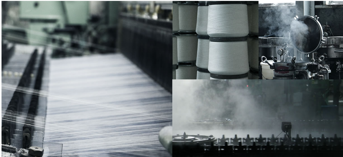
播州産地(兵庫県)、遠州産地(静岡県)の生地や、エジプト綿と呼ばれる高級綿を使用した生地など こだわり抜いた生地を取り揃えています。