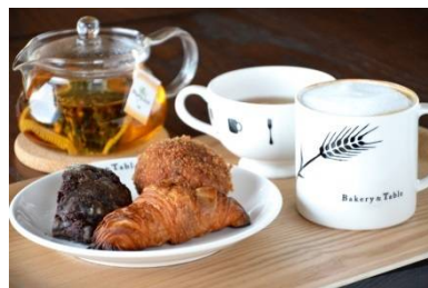
<ベーカリー&テーブル>