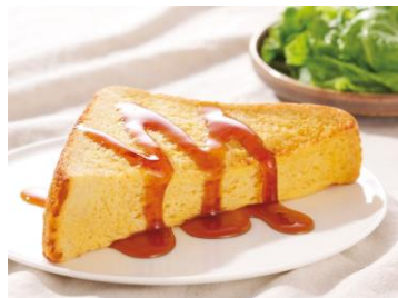
「全粒粉のシュガーフレンチ」 390 円 モーニングセット:590 円～