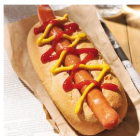
リニューアル 「ボールパークドッグ プレーン」 320 円 モーニングセット:530 円～