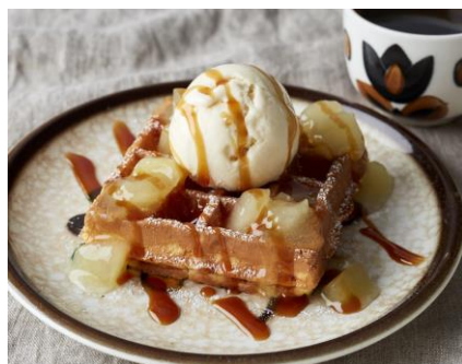
「ブリュッセルワッフル 洋梨キャラメル」770 円 ドリンクセット:980 円～

9月14日(金)より、タリーズで新登場となる「ブリュッセルワッフル」が新たに登場します。外はカリッと、中はもちり＆ふわっとしたオリジナルのワッフル生地、上品でさわやかな甘みの洋梨果肉が入ったソースとキャラメルソースをあわせた「洋梨キャラメル」、朝食にもおすすめしたい「スクランブルエッグ」の2種類をご用意しました。