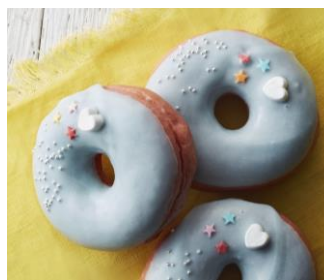
「タリーズユニコーンリング」 290円

ユニコーンカラーの“ゆめかわいい”スイーツの第二弾。もちふわ食感のイースト生地をホワイトチョコでコーティングし、アラザンやカラフルな砂糖菓子、ハート型のマシュマロを飾りました。