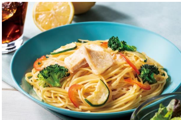
「チキンと彩り野菜の瀬戸内レモンパスタ ～青唐辛子風味～」 単品 780円 ドリンクセット 990円～