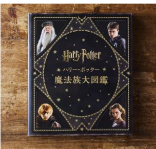
「ハリー・ポッター 魔法族大図鑑」 2,700 円(税込 2,970 円)