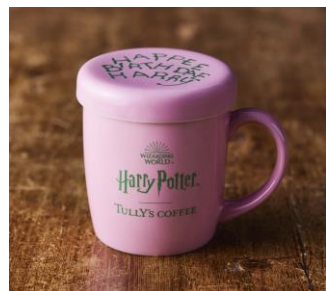
「ハリー・ポッター パースデーマグ」 2,300 円(税込 2,530 円)