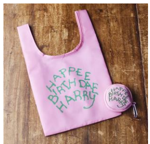
「ハリー・ポッター パースデーエコバッグ」 2,200 円(税込 2,420 円)