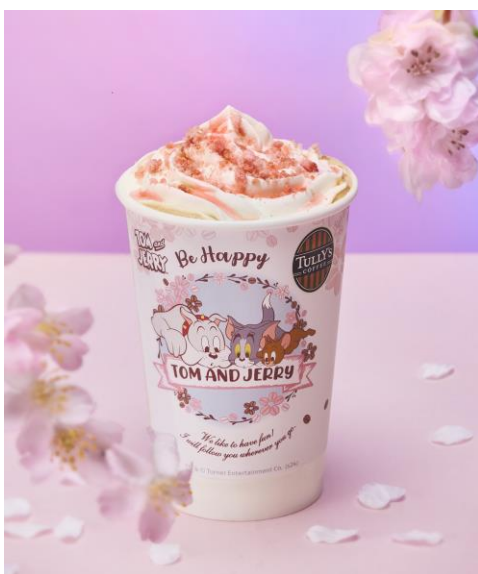
「桜舞う 苺チーズケーキラテ」 (HOT/ICED) Tall サイズのみ:705円(税込)

まろやかな甘みのカフェラテに桜のソースと、食感もお楽しみいただける苺チーズケーキ風味のクラム(スポンジ生地)をトッピング。桜と苺がふんわりと香り、まるで桜が舞っているような華やかな見た目に仕上げました。