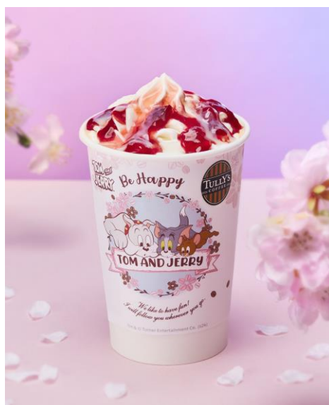
「&TEA 桜香る 苺ロイヤルミルクティー」 (HOT/ICED) Tall サイズのみ:705円(税込)

まろやかな甘みのカフェラテに桜のソースと、食感もお楽しみいただける苺チーズケーキ風味のクラム(スポンジ生地)をトッピング。桜と苺がふんわりと香り、まるで桜が舞っているような華やかな見た目に仕上げました。