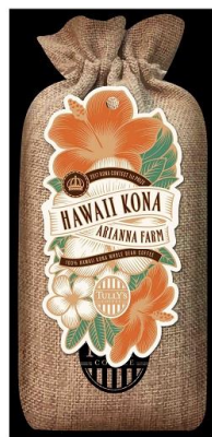
化粧箱と、麻袋風のパッケージで包みました。