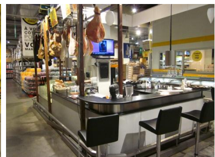
多目的イベントスペースのイメージ