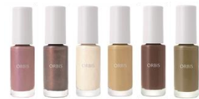
ドライローズ/スターリースカイ/マドンナリリー/ムーンズプライト/メープルウッド/セージグリーン