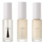
クリア/マット/ホワイトフレーク 『ネイルポリッシュ』全6色