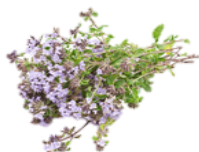
ワイルドタイムエキス