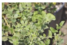
カンゾウ根エキス

■カンゾウ根エキス（保湿成分） 独特の甘みがあることから カンゾウ（甘草）と呼ばれている。 そのカンゾウの根から抽出したエキス。