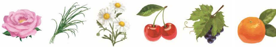
センチフォリアバラ 花エキス

爪への優しさにこだわり選択した、6種のネイルケア成分 *1 で、爪を保湿&保護し、乾燥や欠けから守ります。ベースコートは「ネイルプロテクト処方 *2 」で地爪を保護・補修します。