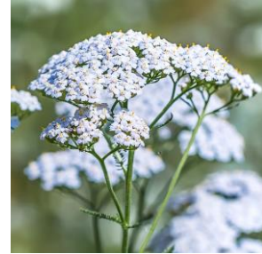
セイヨウノコギリソウエキス

タンニンなどを豊富に含むことが知られており、日本では奈良時代から美容のために用いられてきたチョウジから抽出したエキス。