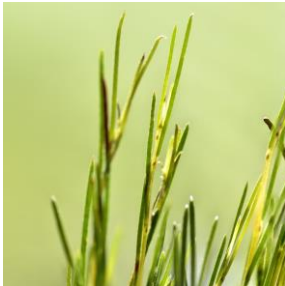
ルイボスエキス (アスパラサスリネアリスエキス)

寒暖差と乾燥が厳しい土地で力強く生き延びる力を持つ植物、ルイボスから抽出したエキス。