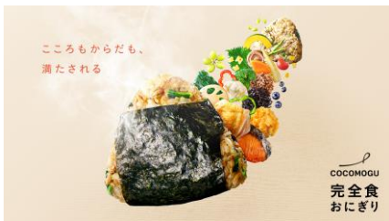
※写真は調理例および食材のイメージです

『COCOMOGU』は2024年5月に発売して以来、「ほぐし焼きさばと煎りごまの大葉香るおにぎり」「ほくほく大豆とひじき煮の鶏五目おにぎり」「ナッツの食感楽しむ豚ひき肉と小松菜の中華風おにぎり」の3種類を展開しています。今回、新たに発売する「こく旨牛肉と人参ほうれん草の香ばしビビンバ風おにぎり」は、お客様からの「普段なかなか食べれないけどおいしいもの」「いつもの生活にはない新しい味があったら」などのご要望をいただき、ビビンバ風味を採用しました。