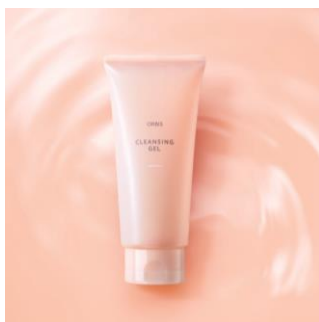
『クレンジングジェル』