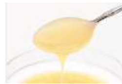
ローヤルゼリーエキス