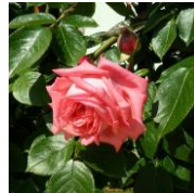
ダマスクバラ精油