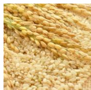
グルコシルセラミド