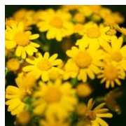
ゴールデンカムミールエキス