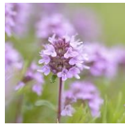
ワイルドタイムエキス