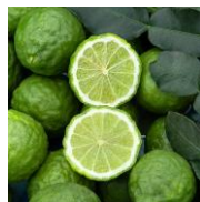
ベルガモット精油