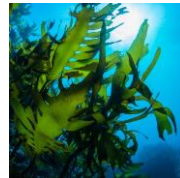
シーグラスエキス