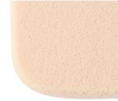
スポンジパフ (自社従来品)

敏感になりがちな肌への負担を軽減した毎日使える設計で、肌の負担を考えた摩擦レスな起毛&抗菌パフを採用。ふわっと包まれるような触り心地のなめらかなパフでやさしくカバーし、美しい仕上がりを叶えます。