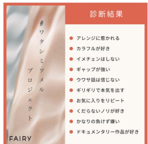
▲診断結果（イメージ）

診断コンテンツ URL： https://www.sincere-vision.com/brand/fairy/project