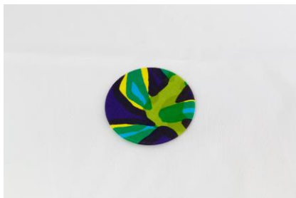
テキスタイルバッジ