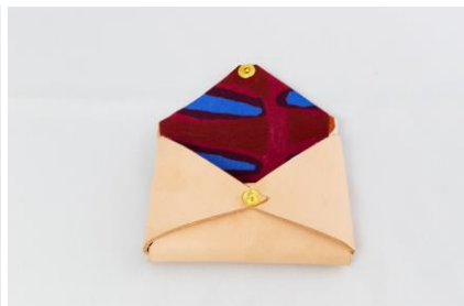
レザーカードケース