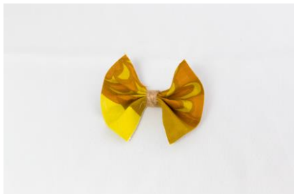
蝶ネクタイ/ヘアクリップ

また、鈴木マサル氏デザインのテキスタイルを使い、「蝶ネクタイ/ヘアクリップ」「レザーカードケース」などを作ることができるワークショップも、あわせて開催いたします。