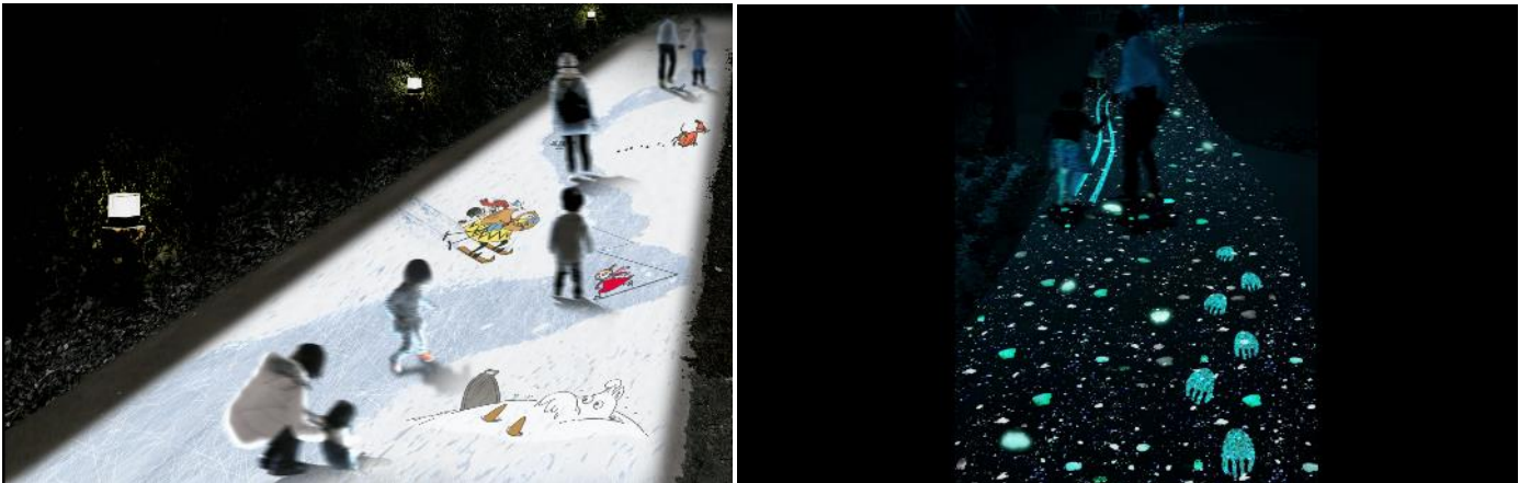
(左) あいまいなものの道 (雪と氷の道)、(右) みんなの足あとの道

園内には、足元にも仕掛けがたくさんちりばめられています。あいまいなものの道では、ムーミンの仲間たちと一緒に雪遊びを、そしてみんなの足あとの道にはいろんな足あとが出現?!?!あの大きな足跡は誰の足あと?などと、プロジェクションマッピングによる演出により、歩くたびに楽しい想像が膨らみます。