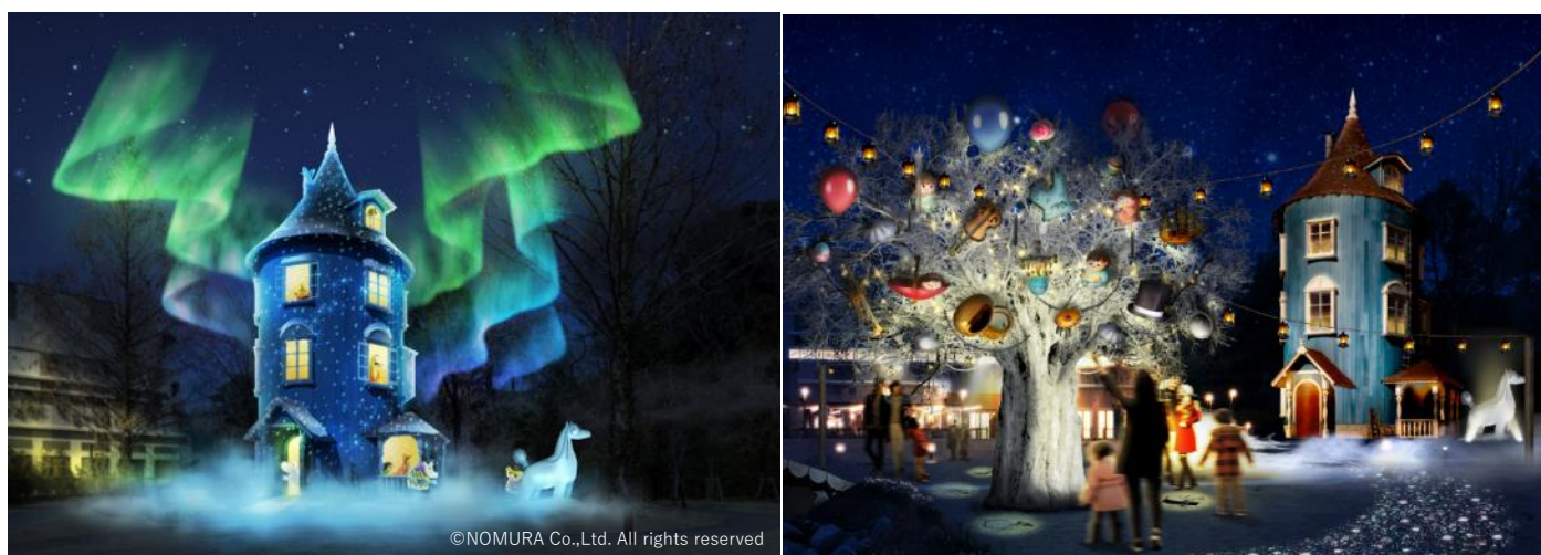
(左) ムーミン屋敷のプロジェクションマッピング、(右) ツリーオブオーケストラ

夜の「ムーミンバレーパーク」は、メインエリアとなる「ムーミン谷エリア」をメインにナイトイルミネーションをご覧ください。ムーミン屋敷で始まるプロジェクションマッピングによる約10分間のショーには、オーロラが出現！その迫力は圧巻です。(※ムーミン屋敷のプロジェクションマッピング及びオーロラは株式会社乃村工藝社が企画・演出・設計・施工を担当しています。) その隣には、約4mの高さとなる冬のシンボル「ムーミン谷のウィンターツリー」が姿を現します。それは音を奏でる不思議なツリー。トランペットやバイオリンなど、まるでオーケストラの舞台のよう。ツリーのそばを通ると光と音による楽しく不思議で楽しく温かな空間が広がります。