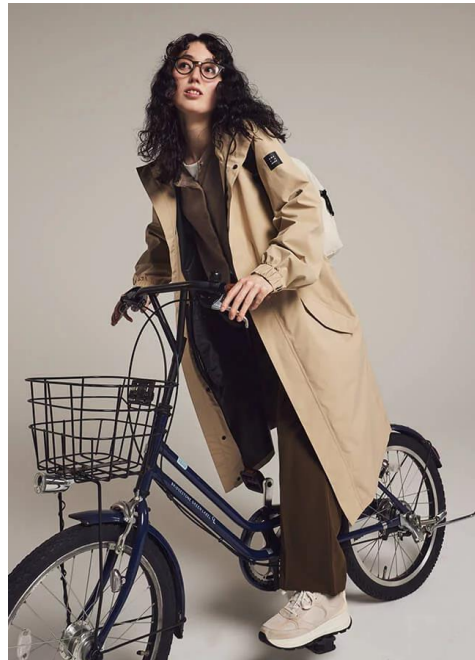
「AH302 サイクルモードレインコートEX」 5,980円(税込) ※Creema SPRINGS 先行販売