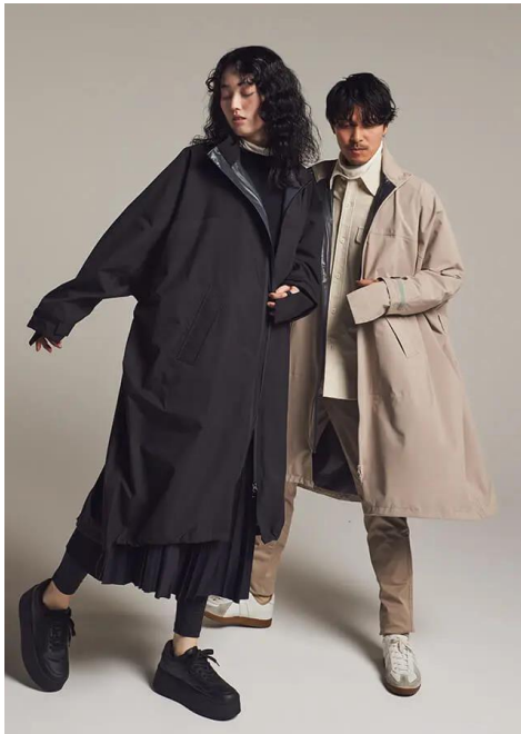
「AH101 サイクルモードハイポンチョEX」 5,980円(税込) ※Makuake先行販売

最先端素材や新しいアイデアを積極的に取り入れた高い機能性で、日本有数のレインウェア取扱量を誇る株式会社カジメイク(本社：富山県高岡市、代表取締役社長：鍛冶功一、以下当社)は、「アメトハレ」ブランドより、自転車走行の安全性を追求した、レインウェアの新しいスタンダード商品を販売いたします。3月20日(水)より「Makuake」、27日(水)より「Creema SPRINGS」にて先行販売を開始、「アメトハレ」WEBサイトでは5月中旬より一般販売いたします。