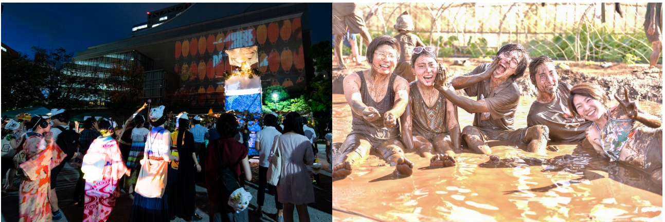
(左：Neo盆踊り 右：Mud Land Fest)