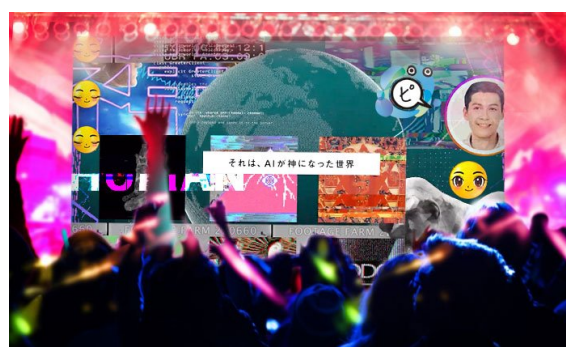
(左：プログラムを遺伝子に見立て、進化計算によって数式自体を変化させることで、アニメーションを生成する映像作品「CharActor」 右：当日のLIVEイメージ画像)