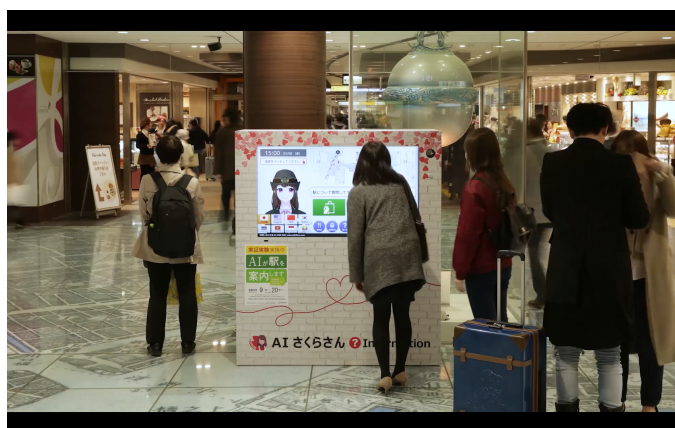
(左：サイバー神社イメージ図 右：AI受付さくらさん)