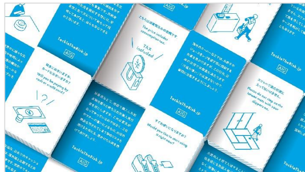
How NOT to Card

「How NOT to Card」は、飲食店や宿泊施設、小売店などの従業員と外国人旅行者が、カードを見せるだけで基本的なコミュニケーションが円滑に取れるようにサポートするカード。食物アレルギーの確認やチップが不要なことを伝えるなど、シーンに合わせたフレーズをカードにしています。全国の飲食店、宿泊施設、小売店などに30,000セット配布を予定しており、上記ウェブサイトで、ダウンロードすることもできます。