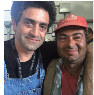
オリーブ生産者のひとりと搾油所にて

1970年パリ生まれ。父はシチリア出身のイタリア人、母はチュニジア系フランス人という地中海人のアイデンティティを持つ。子供のころから好奇心旺盛。綱渡り芸人やピエロ役としてシルク・ド・ソレイユで活躍。退団後、少年期の夏を過ごしてきたシチリアを訪れ、グローバリゼーションのもと画一化されてゆく地元のオリーブオイル産業を目の当たりにしショックを受け、単一畑×単一品種のオリーブオイルの生産に着手。2008年パリ10区(2, rue sainte Marthe 75010)にシチリア産オリーブオイル専門店「ラ・テット・ダン・レゾリーヴ」をオープン。アラン・デュカスやピエール・エルメなど有名シェフに支持されている。2016年パリ14区に2号店オープン。