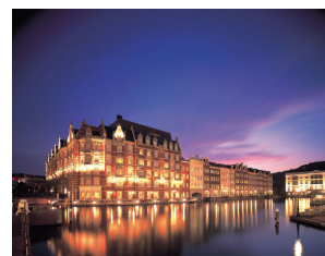
ホテルヨーロッパ

『光のLOVEウォーク』には、イッテミア特設ページから参加することができます。ぜひ、この冬はGPSケータイを使って、ハウステンボスで『光のLOVEウォーク』をお楽しみください。