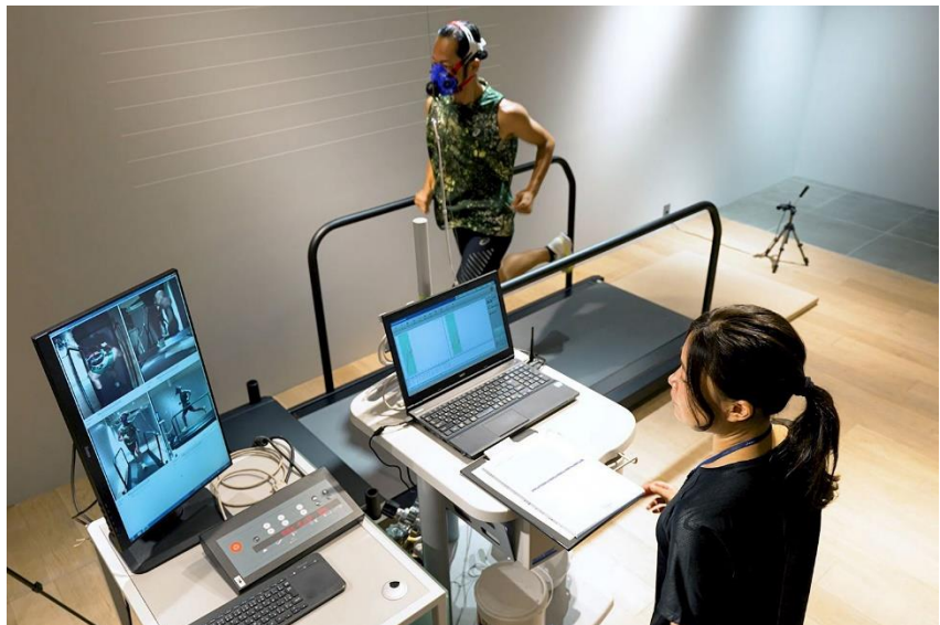
「ASICS RUNNING LAB」の様子

専門機器を使用してランニングの総合的な能力を計測できるサービスで、当ストアではランニングフォーム測定（フル測定21,400円（税込）、フォームのみ測定5,090円（税込）、AT測定（フル測定経験者限定）8,150円（税込））が行えます。スポーツ工学に関する知見と技術を生かし、ランナーの特徴を科学的にとらえ、パフォーマンス向上の指針を提案し、「めざすランナー」へのランニング能力向上をサポートします。