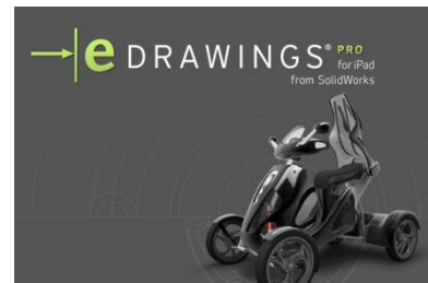
1. iOS デバイス上で動作する eDrawings