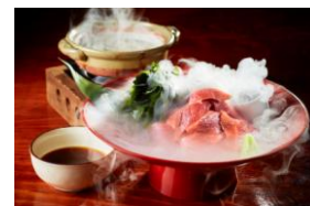
生本マグロのてんこ盛り ¥1,690-(税込)