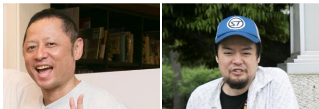
ゆでたまご嶋田隆司×石原まこちん キン肉マン総選挙 2017 結果発表