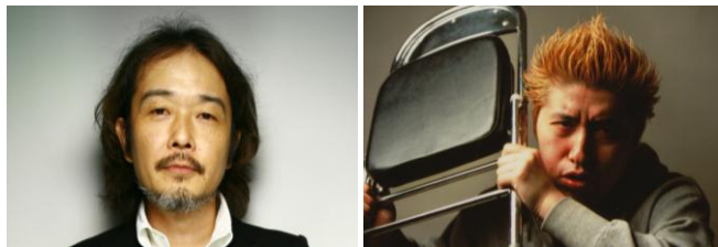
リリー・フランキー×吉田豪×スペシャルゲスト 「公開人生相談」LIVE

『週プレ酒場』では、本誌連載陣を始めとする週刊プレイボーイに縁のある著名人を招いた特別イベント『週プレ劇場』を定期開催いたします。「リリー・フランキーの“公開”人生相談」や「みうらじゅん×宮藤官九郎の大人になってわからない」などの人気コーナーが、本誌を飛び出して『週プレ酒場』に登場。誌面でも大好評の、独特な世界観を肌で味わっていただけます。