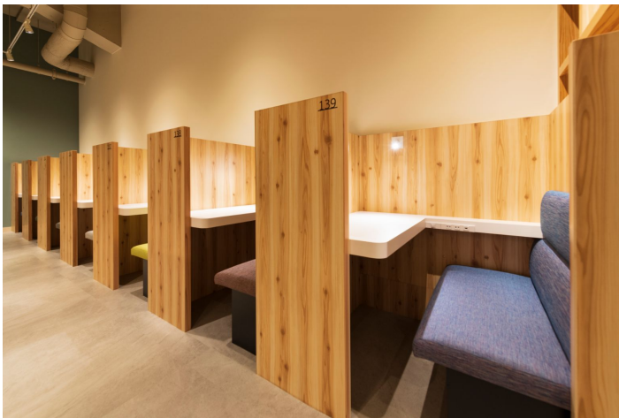
おひとり様用ソファ席

10月15日(木)にオープンした Remo Café 本八幡店の様子→ https://youtu.be/jBAvcJvWh8c