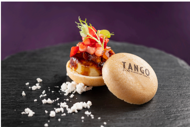
クリスマスディナー特別メニュー「TANGO spécialité」

クリスマスディナー期間中は、レストランフロア以外にも The Place of Tokyo の人気披露宴会場でお食事を楽しむことができます。この期間だけの特別な会場装飾がクリスマスの雰囲気盛り上げます。*また、同時にプロポーズのご予約も可能です。専属のプロポーズプランナーが大切なプロポーズをお手伝いします。Terrace Dining TANGO は、お客様の記憶に残る素敵なクリスマスをご提案します。* ご予約日時によってご案内できる会場が異なります。詳しくはお問い合わせください。