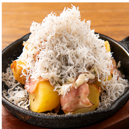
【しらすたっぷりアンチョビポテト】 630 円(税抜)

ご宴会コース以外にも、単品でお楽しみいただける季節限定メニューもご用意しています。旬の食材を使用した季節限定のおすすめメニューもぜひお楽しみください。