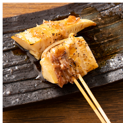
【筍豚巻き串】 200 円(税抜)