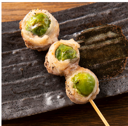
【芽キャベツ豚巻き串】 200 円(税抜)

パリッとした食感と甘みがあるスナ ックエンドウに、塩気のあるベーコン が最強の組み合わせ！