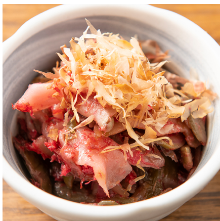
【梅ザーサイ】 280 円(税抜)