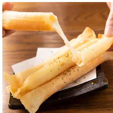
【たらもチーズスティック】 1 本 180 円(税抜)

サクッとしたスティックの中か ら伸びるチーズが！インスタ映 え間違いなしの逸品です！