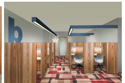
半個室(ブース席)イメージ