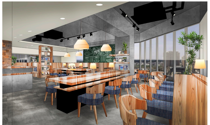
Remo Cafe おたかの森店内観イメージ