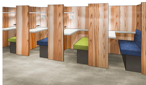
1人ボックス席イメージ