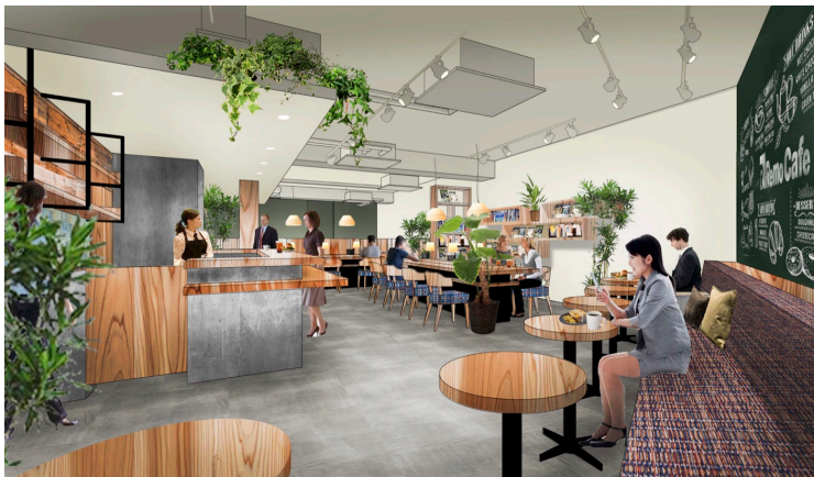
Remo Cafe 本八幡店内観イメージ

飲食事業とプライダル事業を手がけるおもてなし集団、株式会社一家ダイニングプロジェクト（本社：千葉県市川市、代表取締役社長：武長 太郎 以下当社）は、新業態となる『Remo Cafe（リモカフェ）』をオープンします。2020年10月15日(木)には直営1号店目となる『Remo Cafe（リモカフェ）本八幡店』、10月22日(木)には『Remo Cafe（リモカフェ）おたかの森店』を2週連続オープンいたします。