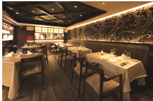
1F レストランフロア