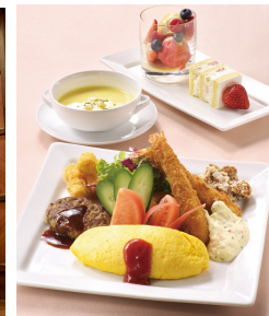
※お子様ランチイメージ